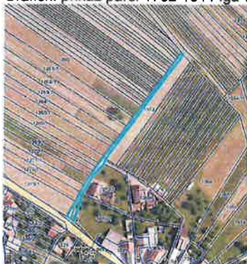
Grafični prikaz parc. 1702 1644 Iga vas (vas Podgora)

Ker pa posamezni deli zemljišč, in sicer parc. 1704/1 k.o. Iga vas; 938/1, 938/2, 947/7, 651/16, vse k.o. Vrh; ter 341/11 k.o. Knežja njiva; ter 815 k.o. Stari trg pri Ložu, predstavljajo funkcionalne dele drugim zasebnim zemljiščem oziroma v naravi niso več namenjena splošni rabi, se pri teh ne zaznamuje grajeno javno dobro. Grajeno javno dobro se vpiše, ko bodo ti deli izvzeti iz teh zemljišč (parcelacija). Izvzeti deli se prodajo oziroma zamenjajo. Za sam postopek parcelacije je potrebna ureditev lastništva na Občino Loška dolina.