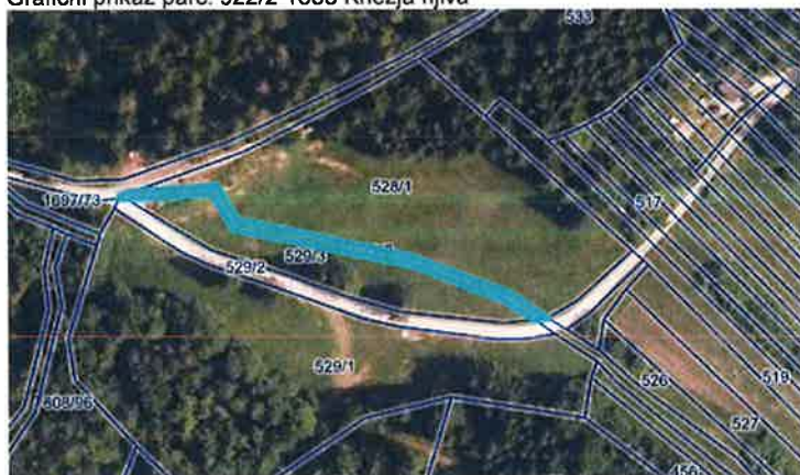
Grafični prikaz parc. 922/2 1638 Knežja njiva

ZUreP-3 v 262. členu določa, da se grajenemu javnemu dobro status lahko odvzame z ugotovitveno odločbo, ki jo na podlagi sklepa občinskega sveta po uradni dolžnosti izda občinska uprava (smiselna uporaba postopka iz 260. člena ZUreP-3). Ko postane odločba o ukinitvi statusa (grajenega) javnega dobra pravnomočna, jo občinska uprava pošlje pristojnemu sodišču, ki po uradni dolžnosti v zemljiški knjig izbriše zaznambo javnega dobra.