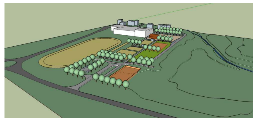
Slika 5: Prostorski prikaz