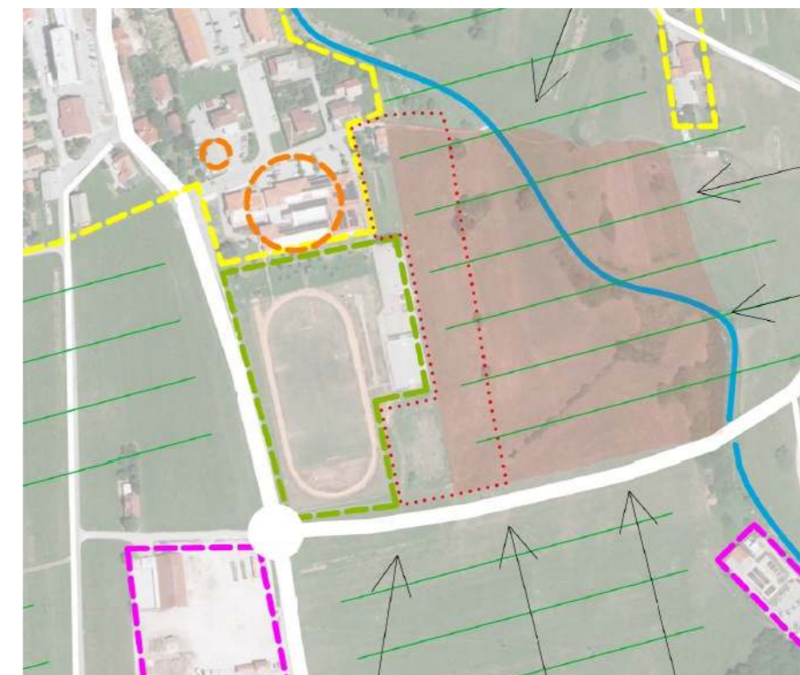
Slika 1: Prikaz območja na DOF

Območje OPPN ST 21 - del obsega skupaj 13.875 m 2 (1,4 ha) in sicer na zemljiščih s parc. št.: 811/2-del, *100, 191/5-del, 216, 217, 218, 222, 220/1-del, vse k.o. Stari trg pri Ložu.