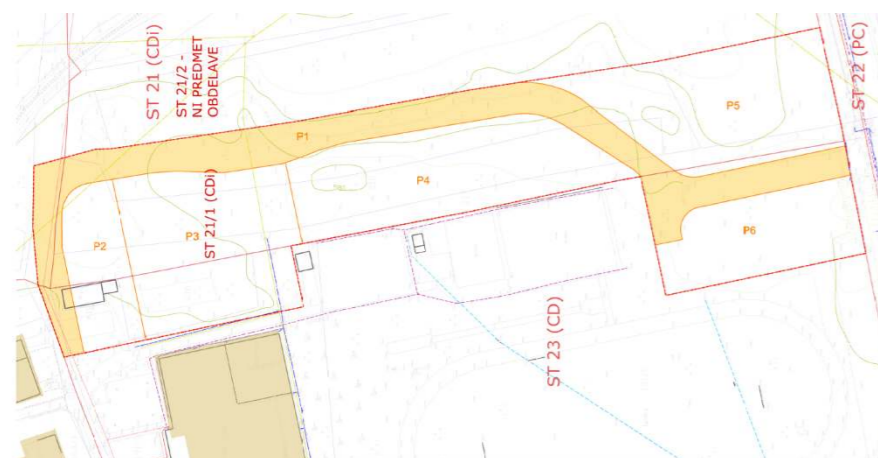
Slika 3: Prikaz predvidene parcelacije

Območje pEUP ST 21/1 je namenjeno ureditvi centralnih in športno rekreacijskih površin. Območje se uredi celovito.