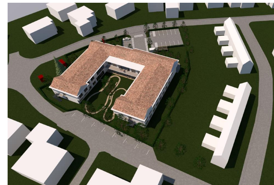
Slika 5: Prostorski prikaz območja