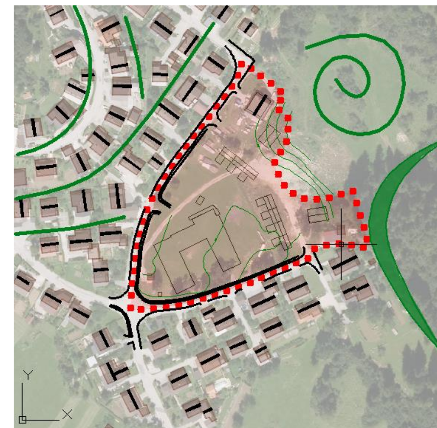
Slika 1: Prikaz območja na DOF

Območje OPPN Ograde obsega skupaj 1,55 ha in sicer na zemljišča s parc. št: 808/14, 808/15, 608-del 618, 619, 620, 621, 808/282-del, 808/214, 808/344, 808/343, 808/311, 808/213-del, 808/292, 808/45, 808/218, 808/346, 808/345, vse k.o. Stari trg pri Ložu (1637).