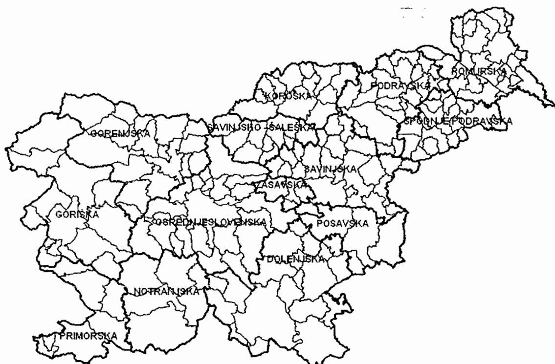
Karta: Predlog regionalizacije Slovenije na 14 pokrajin

Predlagani sistemski zakoni, v skladu z ustavo in Evropsko listino lokalne samouprave zagotavljajo pokrajini pravni status pravne osebe javnega prava in premoženjsko ter finančno avtonomijo, neločljivo povezano s pristojnostmi pokrajine. To pomeni, da imajo pokrajine premoženje in vire financiranja, s katerimi na podlagi pokrajinskega proračuna samostojno upravljajo. Premoženje pokrajine je namenjeno izvajanju njenih pristojnosti, viri financiranja (davčni in nedavčni viri), kombinirani s sistemom finančnih izravnav iz državnega proračuna, pa zagotavljajo financiranje nalog. S predlogi zakonov je urejen prenos pravic na stvarnem premoženju države, namenjenem izvajanju decentraliziranih nalog in prenos ustanoviteljskih pravic v osebah javnega prava tako, da bodo to urejali zakoni, s katerimi bo prenos opravljen.